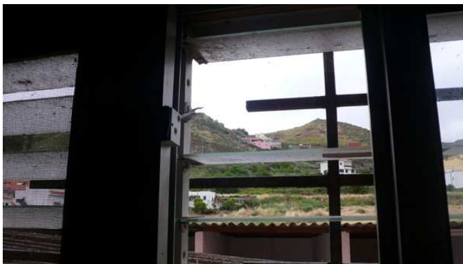
A través de esta ventana, la familia pudo divisar la “pera luminosa”. Al fondo, la montaña de San Roque.