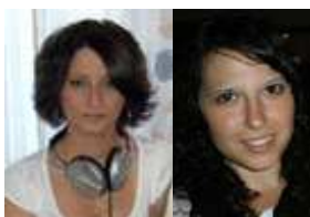
© Cristina Álvarez & Ana Ferrer